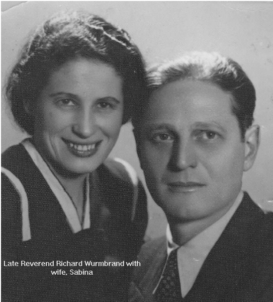
Late Reverend Richard Wurmbrand with wife, Sabina