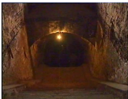
Închisoarea comunistă Jilava. Intrarea spre celulele subterane.

În această lume a durerii, cei ce merg cu Iisus au îndrăzneala de a fi voioși. Ei știu că nici suferința, și nici măcar moartea nu va trimfa. Psalmistul a scris: “Eu am căutat pe Domnul, și mi-a răspuns: m-a izbăvit din toate temerile mele. Când îți întorci privirile spre El, te luminezi de bucurie, și nu ți se umple fața de rușine.” (Psalmii 34: 3-4)