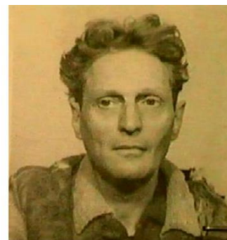
Fotografie a pastorului Richard Wurmbrand în timpul detenției la Jilava