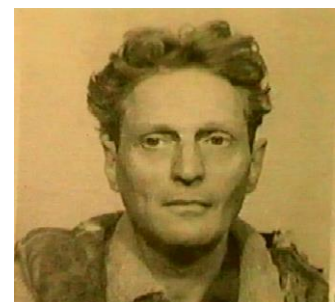
Fotografie a pastorului Richard Wurmbbrand în timpul detenției la Jilava