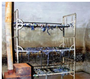
Celulă cu paturi suprapuse, fără saltele, pe care deținuții erau obligați să doarmă. Soba, doar de decor, niciodată încălzită în noaptea geroase de iarnă