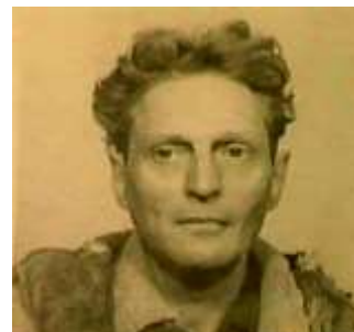
Fotografie a pastorului Richard Wurmbbrand în timpul detenției la Jilava