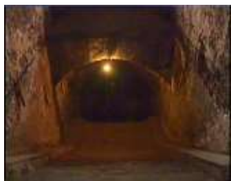
Închisoarea comunistă Jilava. Intrarea spre celulele subterane.

Creștinii nu își caută mângâierea în umbra a ceea ce trece. Nu sunt deprimați din cauza înfrângerilor și eșecurilor. Pot urma victoriile. Nu sunt îmbătați de succese. Acestea de asemenea, nu durează. Numai Dumnezeu rămâne pentru totdeauna. Rămâne cuvântul Său „să nu-Mi fie milă”? Să nu cruț pentru eternitate sufletul care a avut încredere în mine? Ei au o sursă neîntreruptă de bucurie: este bucuria în Domnul etern, a cărui milă au obținut-o pentru sufletele lor veșnice, prin pocăință.