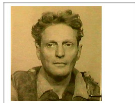
Fotografie a pastorului Richard Wurmbbrand in timpul detenției la Jilava.