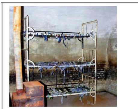
Celulă cu paturi suprapuse, fără saltele în care deținuții erau obligați să doarmă. Soba, doar pentru decor, neîncălzită în iernile friguroase.