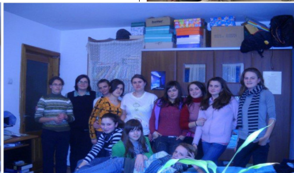
Fete-eleve din sate sărace găzduite în două dormitoare în clădirea Colegiului Richard Wurmbrand