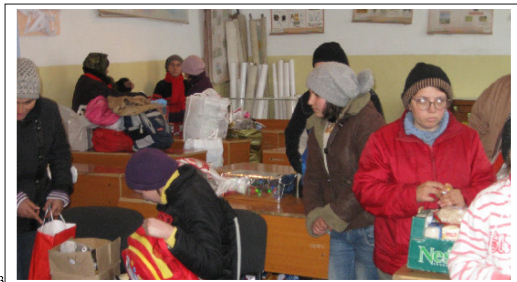
Elevi ai Colegiului Richard Wurmbrand, Iasi pregătind și oferind cadouri pentru săraci din satele din Bosnia.