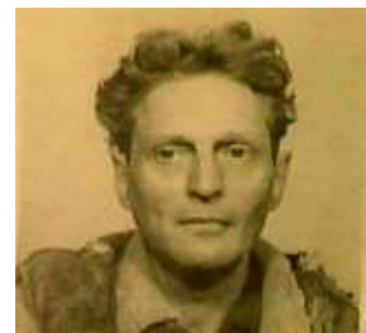
Fotografie a pastorului Richard Wurmbrand în timpul detenției la Jilava