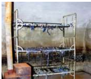
Celulă cu paturi suprapuse, fără saltele, pe care deținuții erau obligați să doarmă. Soba, doar de decor, niciodată încălzită în nopțile geroase de iarnă.