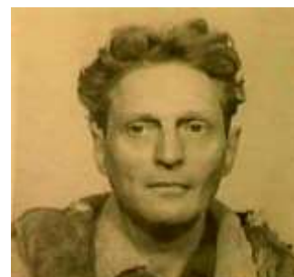
Fotografie a pastorului Richard Wurmbrand în timpul detenției la Jilava