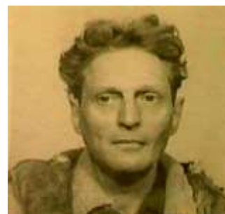
Fotografie a pastorului Richard Wurmbrand în timpul detenției la Jilava