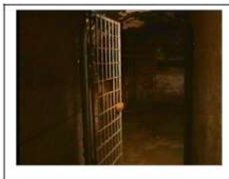
Celulă întunecată la Jilava unde deținuții creștini erau ținuti prizonieri