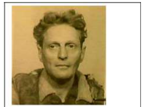
Fotografie a pastorului Richard Wurmbrand în timpul detenției la Jilava