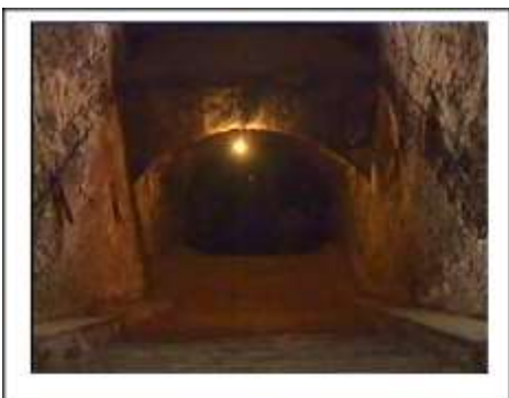
Închisoarea comunistă Jilava. Intrarea spre celulele subterane.

„ Domnul este Dumnezeu! El ne-a făcut, ai Lui suntem ”. Fiindu-ne permis să cunoaștem chiar Cuvântul lui Dumnezeu, permițându-ne să trăim, după ce am primit favoarea de a auzi și de a experimenta iubirea lui Dumnezeu, trebuie să intrăm pe porțile Sale cu mulțumire. Aroganța conducătorilor politici, minciunile lor sunt ceva de care trebuie să râdem. Adevărul lui Dumnezeu dăinuie pentru totdeauna. Minunile descrise în Biblie, minunile lui Iisus descrise în evanghelii nu trebuie comparate cu poveștile de film realizate astăzi. Cuvântul „adevăr” este menționat de cel puțin 26 de ori în Evanghelia după Ioan. Primii apostoli și atât de mulți creștini din istoria umană au fost gata să moară ca martori ai credinței. Persecuțiile, torturile, chiar uciderea creștinilor nu sunt argumente împotriva existenței lui Dumnezeu, împotriva credinței creștine. Acesta este adevărul lui Dumnezeu care durează pentru toate generațiile!