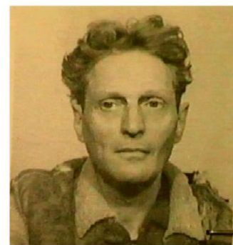
Fotografie a pastorului Richard Wurmbrand in timpul detenției la Jilava.