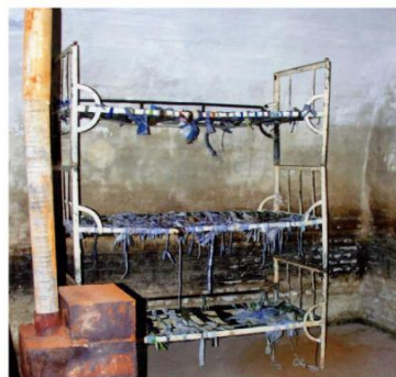
Celulă cu paturi suprapuse, fără saltele în care deținuții erau obligați să doarmă. Soba, doar pentru decor, neîncălzită în iernile friguroase.