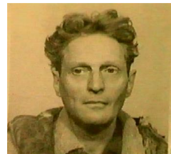
Fotografie a pastorului Richard Wurmbbrand în timpul detenției la Jilava