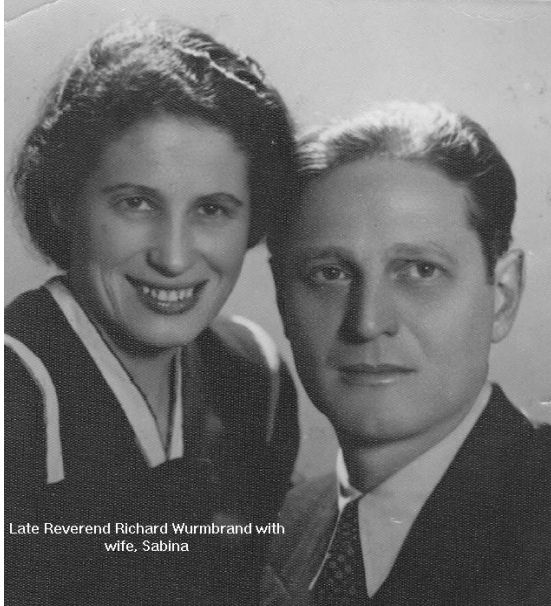
Late Reverend Richard Wurmbrand with wife, Sabina

Ajutăm orfani și creștini în vârstă (mulți cu vârste peste 80, 90 de ani) care au fost închiși pentru credință în actuale și foste țări comuniste. În acest moment de cumpănă ajutăm deasemenea refugiați credincioși din Ucraina!