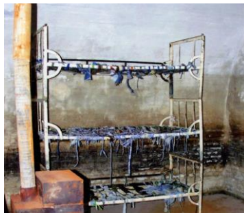
Celulă cu paturi suprapuse, fără saltele, pe care deținuții erau obligați să doarmă. Soba, doar de decor, niciodată încălzită în nopțile geroase de iarnă.