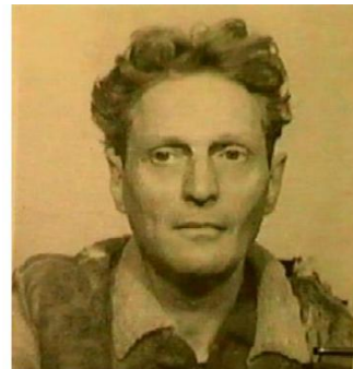
Poză a pastorului Richard Wurmbrand în timpul detenției la Jilava