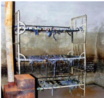
Celulă de închisoare cu paturi suprapuse, fără saltele, pe care deținuții erau obligați să doarmă. Soba, doar de decor, niciodată încălzită în nopțile friguroase de iarnă