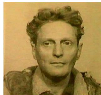
Fotografie a pastorului Richard Wurmbbrand în timpul detenției la Jilava