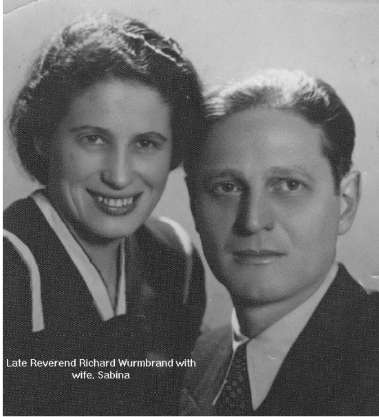
Late Reverend Richard Wurmbrand with wife, Sabina

Ajutăm orfani și creștini în vârstă (mulți cu vârste peste 80, 90 de ani) care au fost închiși pentru credință în actuale și foste țări comuniste. În aceste momente critice ajutăm de asemeni refugiați creștini din Ucraina!