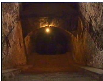
Închisoarea comunistă Jilava. Intrarea spre celulele subterane.

Creștinii care se bucură de atâta libertate nu-și vor uita pe frații și surorile persecutați. Vor găsi o oră să se roage pentru ei și un loc în inima lor pentru a-i iubi.