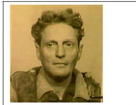
Fotografie a pastorului Richard Wurmbrand în timpul detenției la Jilava.