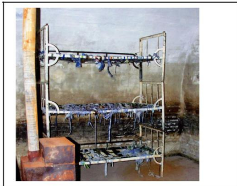
Celulă cu paturi suprapuse, fără saltele în care deținuții erau obligați să doarma. Soba, doar pentru decor, niciodată încălzită în iernile friguroase.