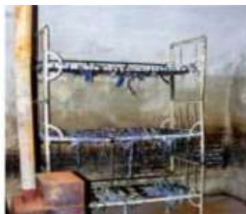
Celulă cu paturi suprapuse, fără saltele, pe care deținuții erau obligați să doarmă. Soba, doar de decor, niciodată încălzită în nopțile geroase