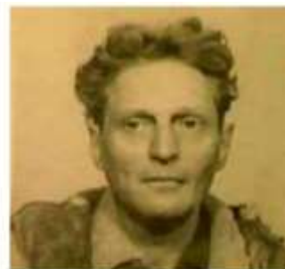
Fotografie a pastorului Richard Wurmbbrand în timpul detenției la Jilava