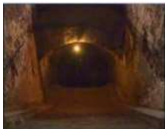
Închisoarea comunistă Jilava. Intrarea spre celulele subterane

Apoi i-am citit povestea învierii. Când a auzit această veste minunată că Mântuitorul s-a înălțat din mormânt, s-a plesnit peste genunchii și a înjurat. S-a bucurat din nou. A strigat de bucurie: "El este în viață, este în viață!" Din nou, a dansat în jurul camerei, copleșit de fericire! I-am spus: "Să ne rugăm!" A căzut în genunchi împreună cu mine. El nu cunoștea frazele noastre sfinte. Cuvintele lui de rugăciune erau: "O, Dumnezeule, ce tip de treabă ești! Dacă eu aș fi fost Tu și Tu ai fi eu, nu ți-aș fi iertat niciodată păcatele, dar tu ești într-adevăr un tip de treabă. Te iubesc din toată inima!". Cred că toți îngerii din cer s-au oprit din ceea ce făceau, să asculte această rugăciune sublimă de la acest ofițer rus. Acest om l-a primit pe Hristos din toată inima. Știa că își va pierde imediat poziția de ofițer, că închisoarea și probabil moartea într-o închisoare sovietică ar urma aproape sigur. Plătea acest preț cu plăcere. Era gata să piardă totul.