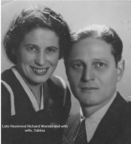
Late Reverend Richard Wurmbrand with wife, Sabina

Ajutăm orfani și creștini în vârstă (mulți cu vârste peste 80, 90 de ani) care au fost închiși pentru credință în actuale și foste țări comuniste. În aceste momente critice ajutăm refugiați creștini din Ucraina!