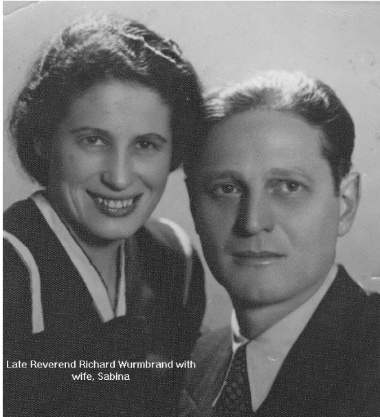
Late Reverend Richard Wurmbrand with wife, Sabina

Ajutăm orfani și creștini în vârstă (mulți cu vârste peste 80, 90 de ani) care au fost închiși pentru credință în actuale și foste țări comuniste. În aceste momente critice ajutăm refugiați creștini din Ucraina!