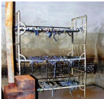
Celulă cu paturi suprapuse, fără saltele, pe care deținuții erau obligați să doarmă. Soba, doar de decor, niciodată încălzită în nopțile geroase