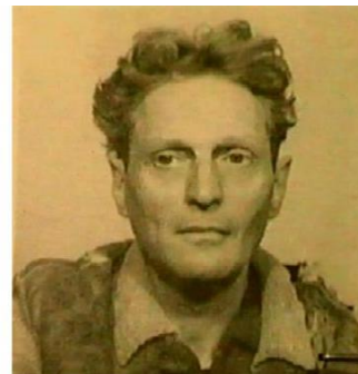
Fotografie a pastorului Richard Wurmbrand în timpul detenției la Jilava