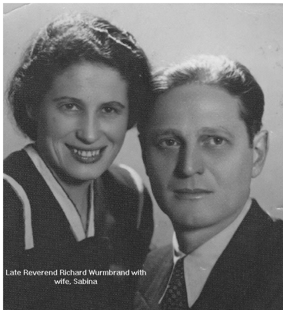
Late Reverend Richard Wurmbrand with wife, Sabina

Asociația Creștină Sabina Wurmbrand Căsuța Poștală 12, OP 74 București, 062580, România Email: apel@asociatiacrestinasabinawurmbrand.ro ; Pagina Web: asociatiacrestinasabinawurmbrand.ro