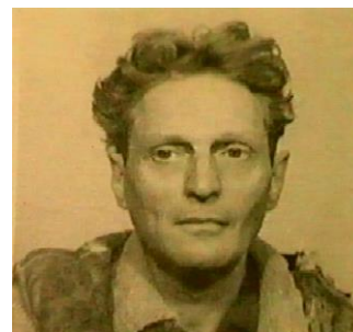
Fotografie a pastorului Richard Wurmbbrand în timpul detenției la Jilava